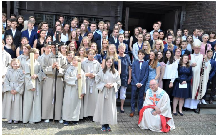
Firmfeier vom Sonntag, 16. Juni 2019 in Herz Jesu

Spiel und Spaß unter dem Motto "Nostalgie" TOMBOLA Ende 16.45 Uhr